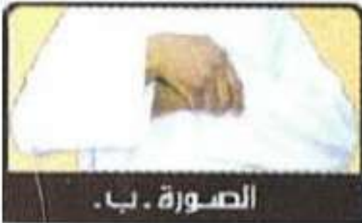
الصورة . ب .

« كان صلى الله عليه و سلم أحيانا يقبض باليمنى على اليسرى »