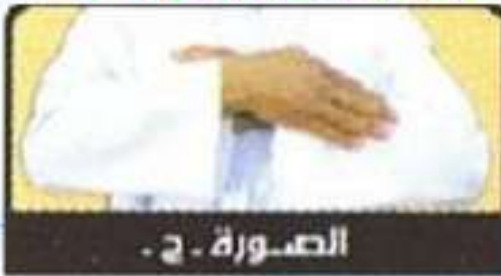
الصورة . ج .

« كان الناس يؤمرون أن يضع الرجل يده اليمنى على ذراعه »