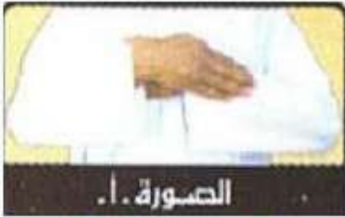
الصورة . أ .

« كان يضع اليمنى على ظهر كفه اليسرى و الرسغ و الساعد »